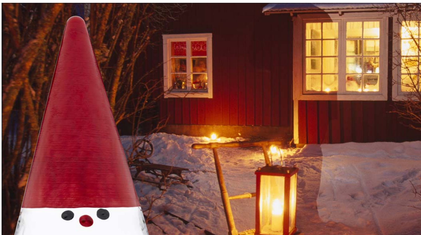
Julmarknad i Kosta 24 november–23 december.