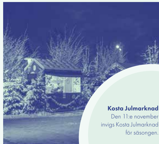
Kosta Julmarknad Den 11:e november invigs Kosta Julmarknad för säsongen.

Periodens resultat var 33,1 MSEK lägre än fjolåret och uppgick till 270,9 (304,0) MSEK. Resultat per aktie uppgick till 2,04 (2,29) SEK.